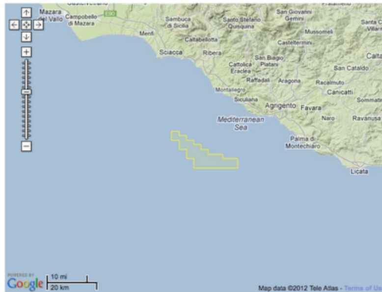
Concessione d29 GR-NP proposta lungo il litorale di Agrigento

La Northern Petroleum afferma in conclusione che dato il carattere temporaneo delle operazioni air gun, i suoi impatti ambientali saranno nulli. Queste affermazioni sono da considerarsi inaccettabili, considerato che - come già detto - lo scopo finale della Northern Petroleum è estrarre petrolio per i prossimi decenni e non solo eseguire ispezioni sismiche per 15 giorni, e soprattutto considerato che la protezione di aree naturalistiche di pregio o di ripopolamento ittico dovrebbero essere di primaria importanza, per la loro valenza ambientale ed economica. In altri paesi come in Norvegia o lungo le coste pacifiche ed atlantiche degli USA, le zone in cui è vietato trivellare, eseguire sondaggi sismici e in generale operazioni petrolifere è dell'ordine delle centinaia di chilometri da riva, e non dieci, per garantire l'assoluta integrità del mare e delle attività esistenti.