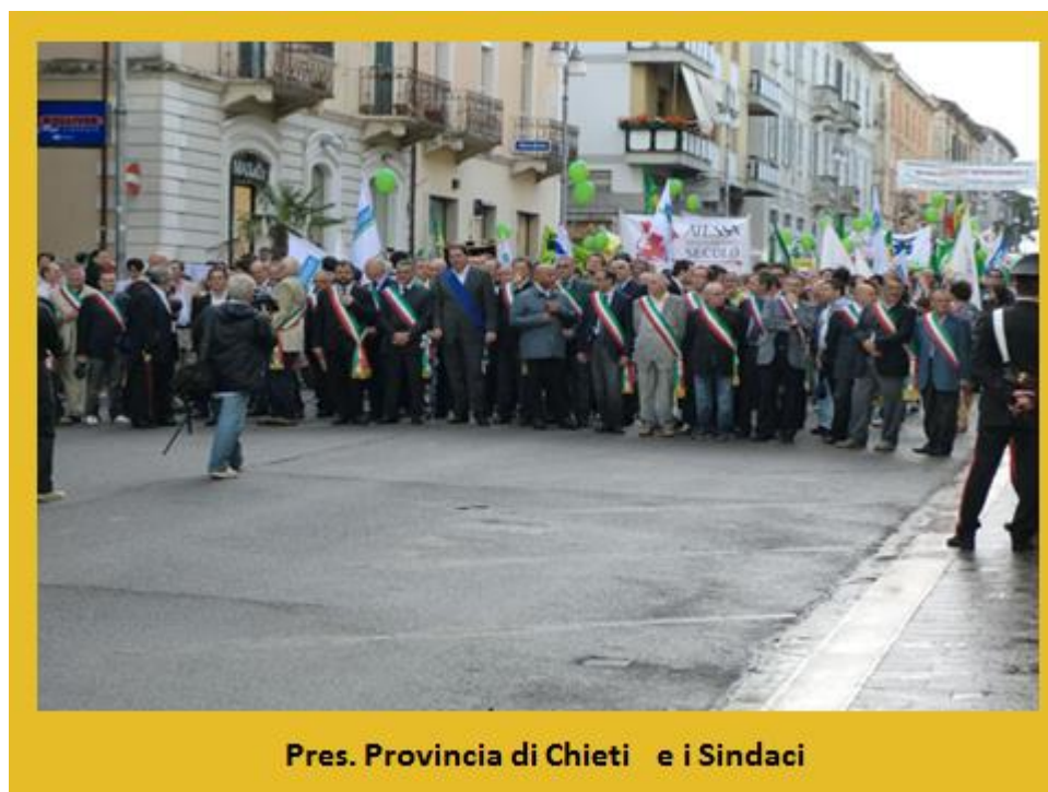
Pres. Provincia di Chieti e i Sindaci

Il procedimento di AIA presentato dalla Medoilgas ed imposto dal TAR del Lazio il 16 Aprile 2014 non aggiunge nulla di nuovo a quanto già' diffuso dalla Medoilgas. Non esistono dunque le basi per ulteriori valutazioni del progetto che possano dissiparne dubbi e i fortissimi motivi di contrarietà espressi nel corso degli anni da tutto l'Abruzzo civile nonché dalla Commissione Tecnica VIA-VAS con parere n. 541 del 07.10.2010. Fra questi la potenzialità di inquinare il mare e l'atmosfera con il rilascio e l'incenerimento di sostanze tossiche, i danni alla pesca e alle zone di ripopolamento ittico presenti all'interno della concessione, l'uso di fanghi aggressivi e di tecniche di acidificazione e fratturazione come già dichiarato durante le fasi preliminari del 2008, il rischio sismico, di subsidenza indotta e di erosione della costa, il rischio di incidenti, la distruzione di tutti i progetti di turismo sostenibile lungo il Parco Nazionale della Costa dei Trabocchi, la scarsità del petrolio da estrarre, i dati poco trasparenti diffusi dalla Medoilgas e il suo esiguo capitale sociale che non le consentiranno di far fronte a possibili incidenti. Tutta la società civile d'Abruzzo, dalla Chiesa ai commercianti, dagli operatori turistici a quelli agricoli, si è espressa contro Ombrina, incluse le 40,000 persone scese in piazza il giorno 13 Aprile 2013. Il diniego di questo progetto è imposto dai più elementari principi di democrazia.